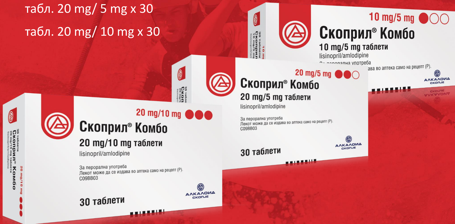
табл. 20 mg/ 10 mg x 30